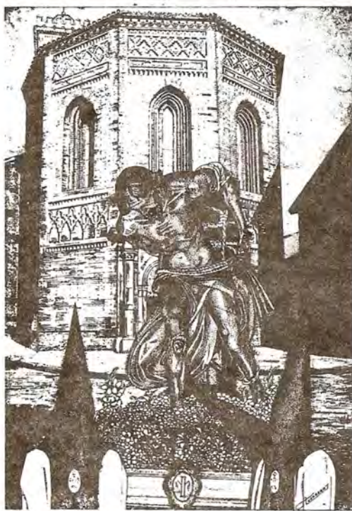
RECUERDOS DE LA PARROQUIA (I) EVOCACION DE LA SALIDA DE LA COFRADIA DE JESUS ATADO A LA COLUMNA DE LA IGLESIA DE SANTA MARIA MAGDALENA (1941-1965)