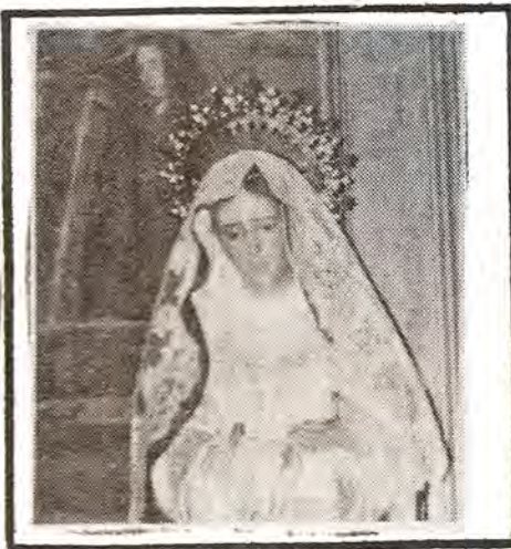
imagen de Nuestra Señora de la Fraternidad en el Mayor Dolor

Aunque ya hemos sobrepasado los dos kilos, necesitamos llegar a los cinco para poder realizar la corona cuyos bocetos visteis todos los asistentes al último capítulo general. ¡Que si no tenéis plata, también podéis hacer donación de alguna pieza de oro!, por eso no hay que amurarse.