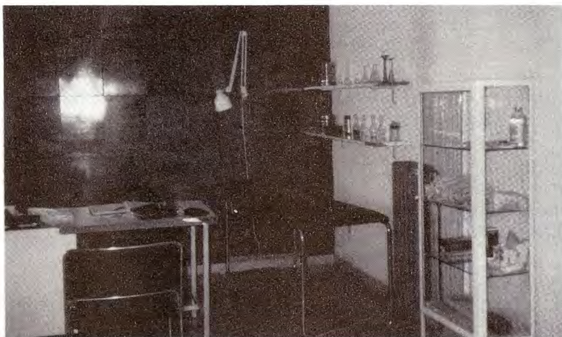
Consultorio médico del barrio de la Almozara