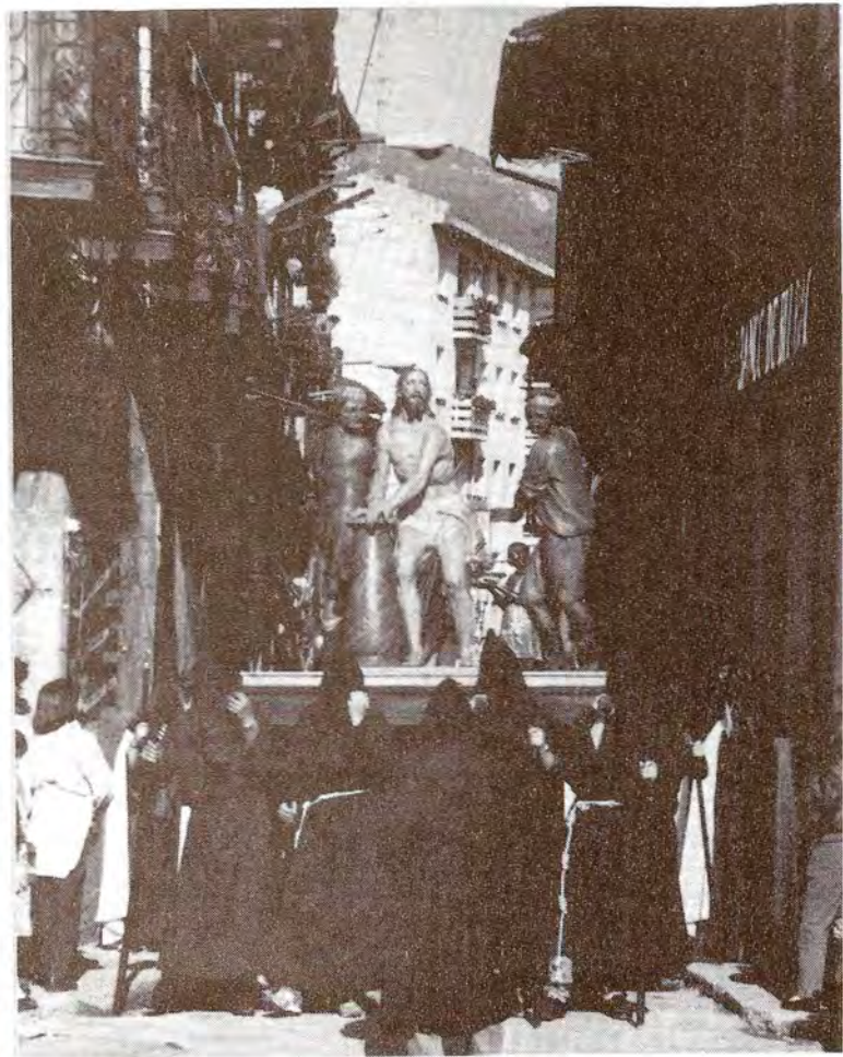
SANTA ESCUELA DE CRISTO

Procesiona dos pasos: el de "La Flagelación", paso de misterio compuesto por cuatro figuras, siendo la imagen de Jesús obra de los imagineros Ramón y Salvador, de Valencia, y realizada en 1.950. El resto de las figuras se añadieron en 1.952. El segundo paso es Nuestra Señora de la Esperanza, obra de Carlos Román, también de Valencia.