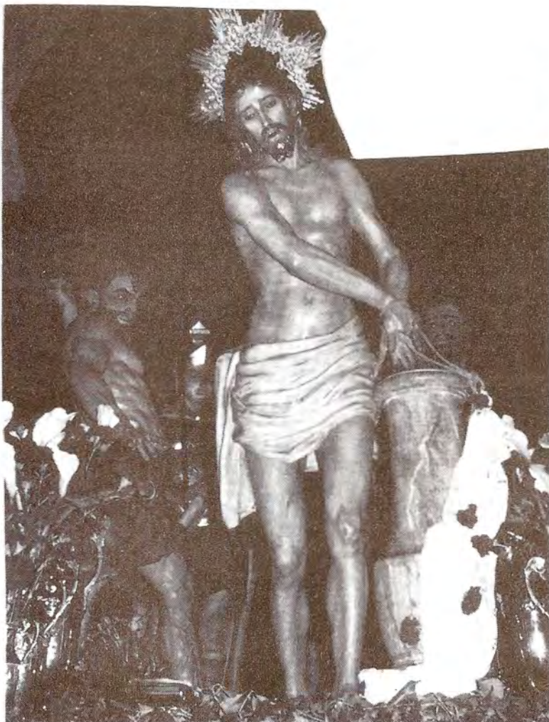
HERMANDAD DE JESUS ATADO A LA COLUMNA Y NUESTRA SEÑORA DE LA ESPERANZA.