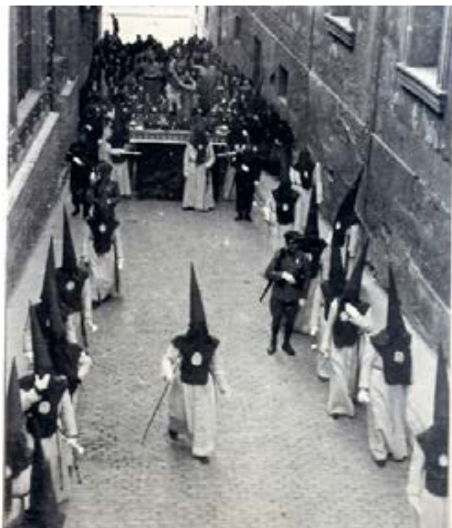
13. La vuelta desde el Pilar a san Cayetano también ha cambiado: en un principio se iba por detrás, por las Murallas Romanas, recorrido que se mantuvo hasta 2006, y ya en 2007 se cambia para volver por las calles