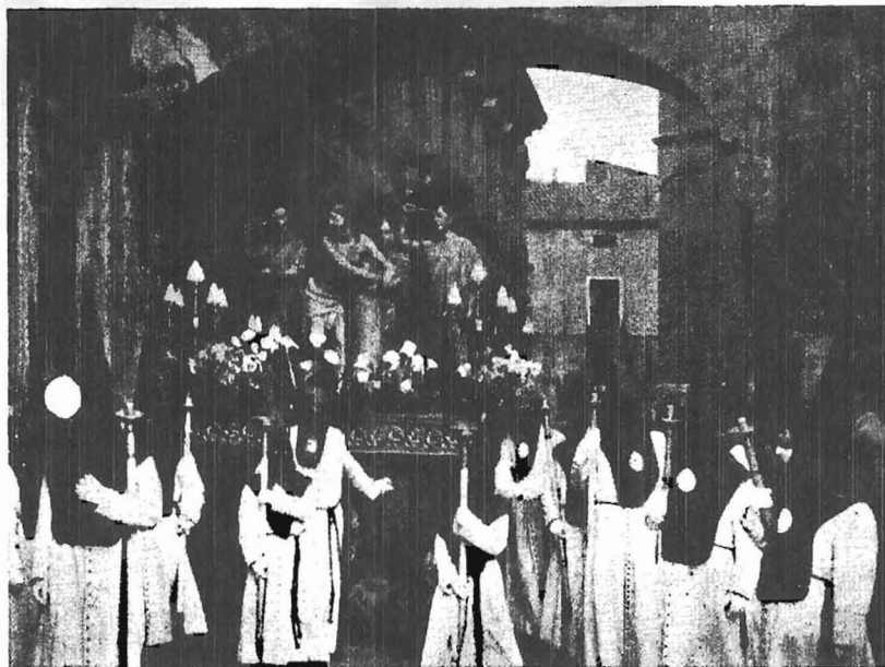
Detalle del desfile de nuestra Cofradía a su paso por el Arco del Arzobispo

No figuran entre los Hermanos expresados, los componentes de la Junta de Gobierno, los que tienen nombrado cargo en nuestros desfiles procesionales, los que llevan representación en este día en las demás Hermandades, los que se encuentren algo delicados para este fin y algunos de cierta antigüedad en nuestra Cofradía, todo ello para que disfruten de estos piadosos turnos de guardia a Nuestro Señor Atado a la Columna, aquellos Hermanos que hasta ahora no habían sido designados.