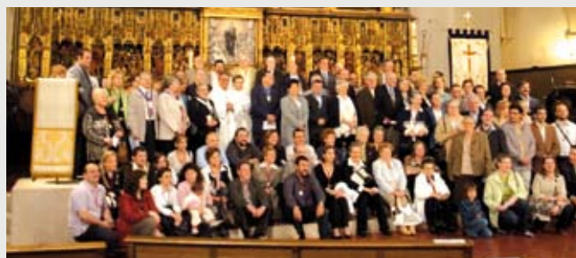
Año Santo Paulino. La Cofradía peregrino hasta la Iglesia de San Pablo para ganar el Jubileo.