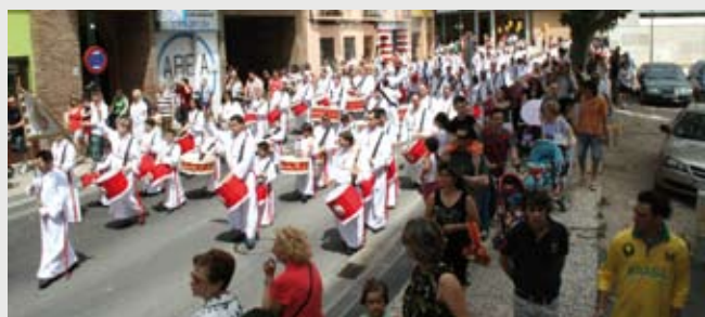
Como ya es tradición desde hace más de treinta años, la Cofradía participo en la Festividad de San Antonio en el Barrio Jesús.