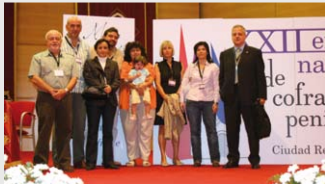
Huesca y Ciudad Real fueron los puntos de Encuentro de los Cofrades de toda España a nivel nacional y regional. En las fotos asistentes a ambos Encuentros.

Procesión General del Santo Entierro. Parece que el tiempo últimamente no es favorable a esta antiquísima y tradicional procesión ya que, tras muchos años saliendo a la calle sin interrupciones, en los últimos cinco años ha habido que suspender tres (los impares: 2005, 2007 y 2009) por problemas de tiempo. Esperemos que cambie la racha.