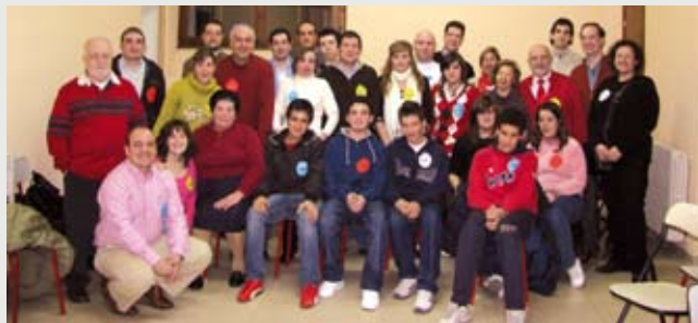
Jornadas de Bienvenida 2009, primer punto de contacto de los nuevos cofrades con la Cofradía.