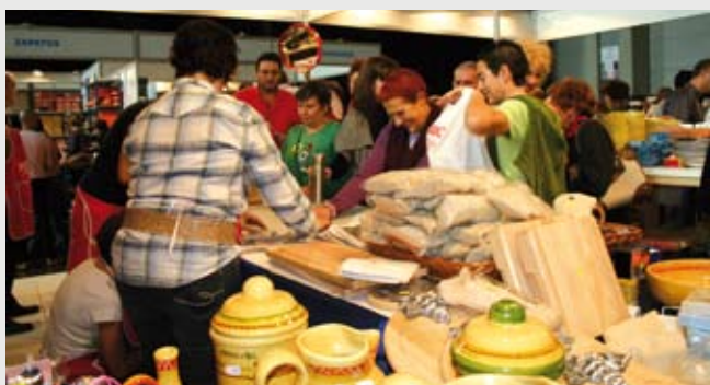
El Rastrillo fiel a su cita en octubre/noviembre, se va consolidando como uno de las actividades con mas proyección hacia la conciencia social de la Caridad.

la grandiosidad de nuestro Paso Titular, quedando a la vista y veneración de todos los hermanos, para que a partir de ahora sea más fácil, cómodo y atrayente dedicar algún rato para visitarlas y sobre todo para rezarles. Se ha conseguido una gran comodidad para poder subir a venerarlas y, en algunos casos, para descubrir la cara de ese Cristo de La Flagelación que hasta ahora muchos no habían visto todavía de cerca. Por supuesto que ha ganado también mucho nuestra Virgen que ahora se exhibe con toda su belleza y nos muestra su dolor al lado de esa impresionante imagen de Cristo que centra todo el altar y que también ahora puede verse restaurada. Sin duda que ha sido una intervención muy ambiciosa y de excelentes resultados pero que, por otra parte, al haberse realizado sin préstamos ni derramas, ha dejado totalmente vacías las arcas de la Cofradía. En resumen, nuestras imágenes, que son nuestro principal patrimonio tanto a nivel espiritual como artístico, lucen ahora en todo su esplendor. Las intervenciones de este año han ido encaminadas a terminar pequeños detalles que faltaban para finalizar el conjunto: - se colocaron las placas con el nombre