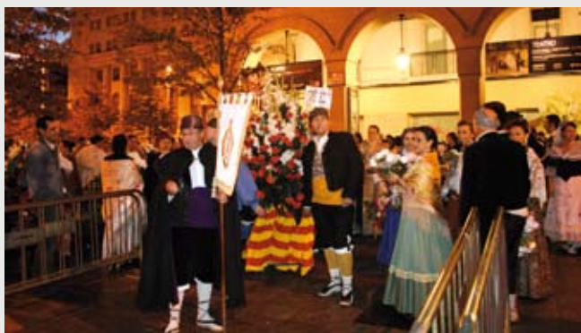
Cuando aun no ha amanecido, con las primeras luces del alba, la Cofradía se dispone a participar en la Ofrenda de flores, en la foto momentos antes de la incorporación a la misma.