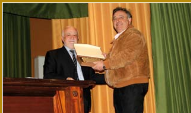
Distinción Semana Santa 2008, entregada en el Capítulo del 2009, al Ilustre Colegio Notarial de Aragón.

la constante colaboración que esa institución viene prestando a la Semana Santa de Zaragoza con la cesión del Palacio de Sobradriel en la plaza del Justicia para que se puedan guardar en sus dependencias las peanas de varias cofradías.