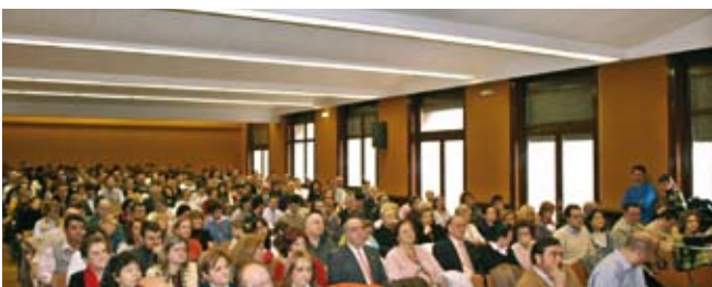
Los Capítulos generales se celebraron como es preceptivo en los meses de Febrero y Diciembre.