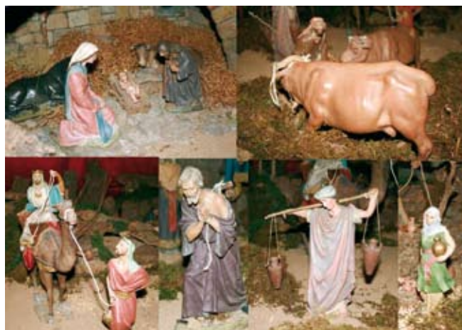
Un año más se montó el Belén en la parroquia de Santiago