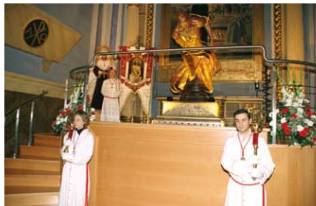
En Septiembre tuvo lugar la bendición e inauguración del nuevo altar de la Cofradía