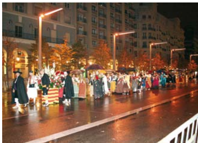
No se faltaron a actos tradicionales como la ofrenda de flores a pesar de las inclemencias del tiempo

impresionante imagen de Cristo que centra todo el altar y que también ahora puede verse restaurada. Sin duda que ha sido una intervención muy ambiciosa y de excelentes resultados pero que, por otra parte, al haberse realizado sin préstamos ni derramas, ha dejado totalmente vacías las arcas de la Cofradía. En resumen, nuestras imágenes, que son nuestro principal patrimonio tanto a nivel espiritual como artístico, lucen ahora en todo su esplendor.