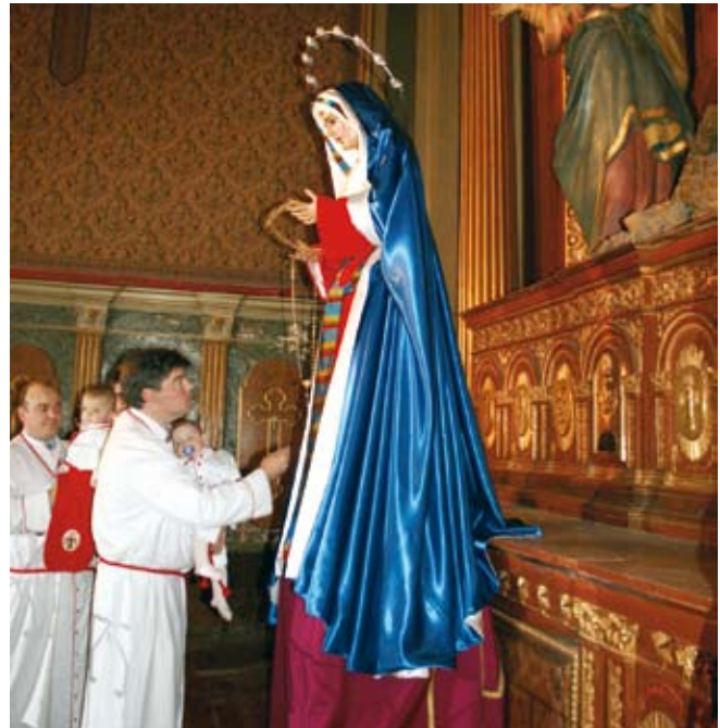
Al estar la imagen Titular del Señor Atado a la Columna en restauración fue la Imagen de Nuestra Señora de la Fraternalidad en el Mayor Dolor la que presidió el acto de besamanos del día de la Fiesta Principal.

(los días 22 y 23) y del que se informó extensamente en las revistas COLUMNA de mayo y septiembre del año pasado.