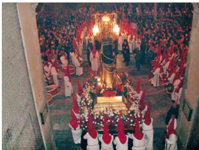
Gran expectación había en la calle para ver la salida del paso titular totalmente restaurado y no haber salido a la calle en el 2007 a causa de la lluvia