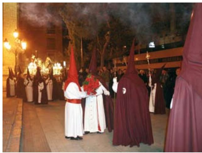
El lunes santo tuvo lugar un acto de cortesía con la Cofradía de Jesús Camino del Calvario, al realizar la predicación de las Tres Caídas en la puerta de nuestra Sede Canónica.

reunión informativa de todas estas actividades mencionadas, normalmente los primeros jueves de cada mes, de la que se realiza la correspondiente acta que se envía a todos los colaboradores de la Obra Social.