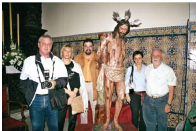
Al igual que años anteriores la Cofradía participó en los Encuentros Nacionales. En la foto asistentes al III Encuentro Nacional de Cofradías y Hermandades de la Flagelación