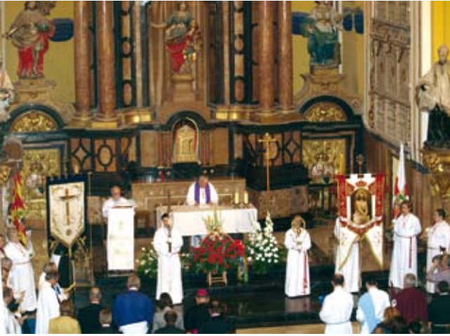
La Cofradía fue la encargada de la Organización del Pregón de Semana Santa.