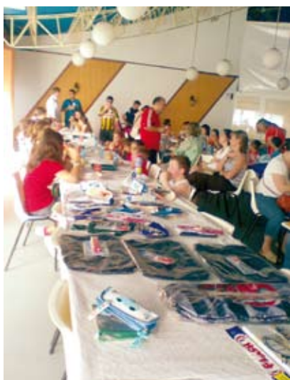
Como viene siendo habitual también hubo tiempo a lo largo del año para los más pequeños; en la foto, fiesta en el Parque de Atracciones