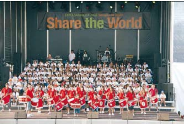
Sin duda alguna la EXPO 2008 fue un acontecimiento que será recordado durante mucho tiempo, nuestros jóvenes cofrades pudieron participar en la misma a través de un acto de confraternización organizado por la O.N.G "Share the World" con jóvenes de Portugal, Japón y Senegal.

mentos que este año se ha visto revitalizada de una forma muy importante al realizarse en el Club El Soto mejorando las anteriores en todos sus aspectos: comida, regalos, baile, etc., pero sobre todo en el ambiente que reinó toda la noche. A muchos nos pareció retroceder en el tiempo a aquellas primeras cenas de Helios. Como el año anterior tuvo lugar el sábado siguiente a la Semana Santa.