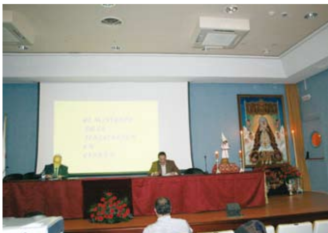
Participación en los actos del XXV aniversario de la fundación de la Cofradía de La flagelación de Ciudad Real