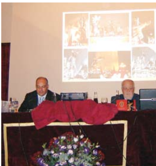
Presentación del C.D. La Flagelación en España a nivel nacional en Puerto de Santa María (Cádiz).