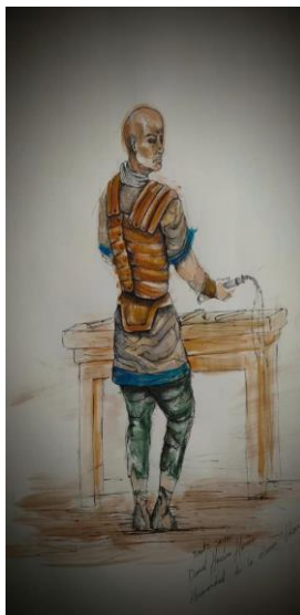
Figura secundaria que completará el grupo escultórico de la Real Cofradía Jesús en la Columna, coincidiendo con los actos del 40 aniversario de la refundación. Se trata de un soldado romano en posición de contraposto preparando un flagelo e irá acompañado de una mesa con todos los utensilios que se utilizaron durante la Flagelación de Nuestro Señor Jesucristo, ubicado en el paso procesional detrás de la imagen de Jesús, dicho soldado romano será tallado en madera de cedro real proveniente del Líbano y pintado al óleo teniendo una altura de 1'65 metros.