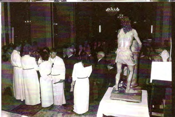
Peregrinación a la Villa de Mallén, única población aragonesa que tiene como patrón al Señor Atado a la Columna. Primera salida procesional fuera de Zaragoza de la "Reliquia de la Santa Columna de Jerusalén".