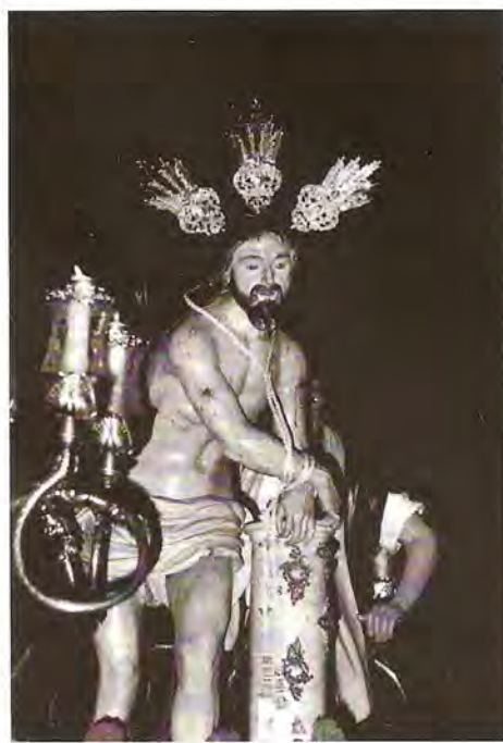
Nº 52 Jerez de los Caballeros (Badajoz). Tres pasos.

PONTIFICIA Y REAL COFRADÍA DEL SEÑOR CORONADO DE ESPINAS, SANTÍSIMO CRISTO DE LA FLAGELACIÓN Y MARÍA SANTÍSIMA DE LA AMARGURA