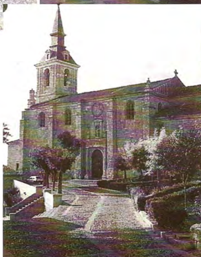
Excursión: "A la búsqueda de la Espiritualidad Monástica".