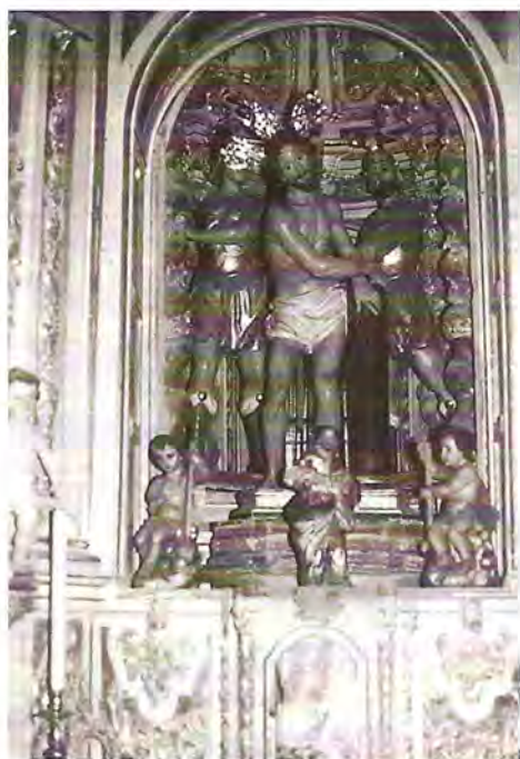
Nº: 51 Arcos de la Frontera (Cádiz). Tres pasos.

SANTA Y VENERABLE HERMANDAD DEL SEÑOR ATADO A LA COLUMNA Y NUESTRA SEÑORA DE LA PAZ Y SAN ANTONIO DE PADUA