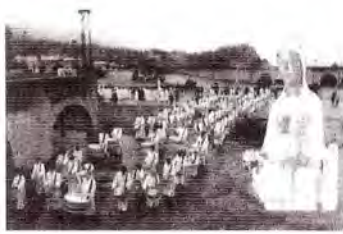
Nº 3 Peregrinación de la Cofradía al santuario de TORREDELCUADO Abril 1996