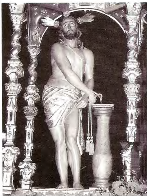
Nº: 47 Puente Genil (Córdoba). Un paso.

La primera cofradía relacionada con los Azotes de la que se tiene constancia data del año 1.593, y según los historiadores podría ser incluso anterior a 1.558. Pasó por tener diferentes nombres, si bien por la disciplina practicada por sus cofrades se llamó definitivamente "De los Azotes".