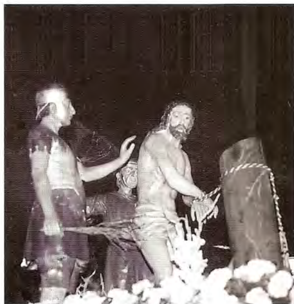
Nº 48 Burgos. Un paso.

Es una de las dos cofradías que en esta ciudad tienen advocación en el "Misterio de la Flagelación".