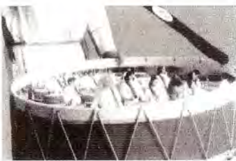
Nº 2 Participación de la Sociedad de Instrumentos en el celebración Nacional de España. Música Sevilla 1996