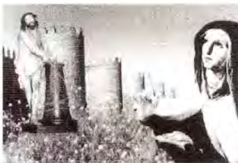
Nº 5 Visita a AVILA SGGVIA Siguiendo la huella de Sta. Teresa San Juan de la Cruz (siguiendo la tradición) y el convento Mayo 1996