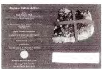
Nº 4 Altar de la Santa Columna de Jerez Según la tradición se elevó por el Maestro Fr. San Juan Marzo 1996