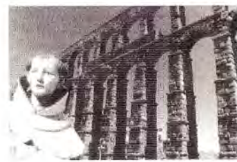
Nº 6 Visita a AVILA-SGGVIA Siguiendo la huella de Sta. Teresa San Juan de la Cruz (siguiendo la tradición) y el convento Mayo 1996