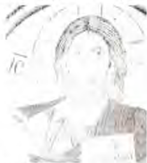
↑ (B) Cristo Pantocrátor ← (A) Faz de Cristo tal y como lo vieron los artistas bizantinos al comtemplar la Síndome.