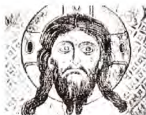
↑ (C) Fresco de Nereditsa, destruido en 1.199 → (D) Icono del Siglo XII