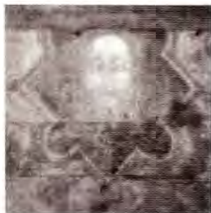
↑ (F) Cristo de los templarios en Templecombe (Inglaterra) ← (E) Mosaico en Dafni del s. XI