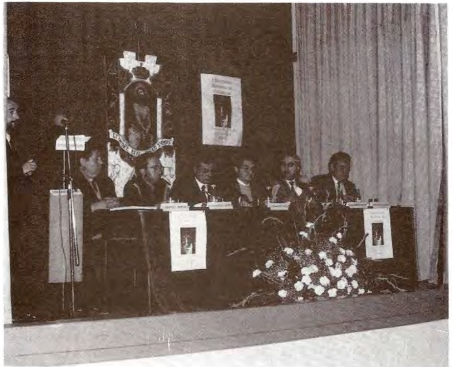
TERCERA MESA: Perspectiva de la Semana Sant5a en Aragón. Representantes de Zaragoza, Teruel, Barbastro, Bajo Aragón y provincia de Zaragoza.