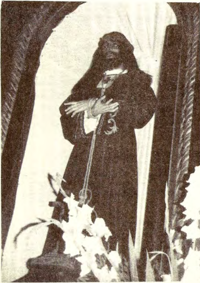
Nuestro Padre Jesús Redentor de Cautivos Nuestro Padre Jesús de la Pasión Jesús Atado a la Columna