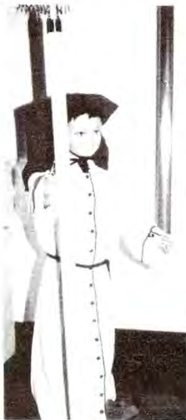
Niño con Tercerol

Ante la gran cantidad de llamadas que de todo tipo se producen en Secretaría, LOS JUEVES de 7'30 a 9 de la tarde, habrá montada una oficina de información en el atrio de la Iglesia de Santiago para todo tipo de asuntos. Estamos a vuestra disposición.